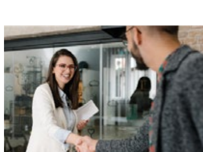
Acceso a la bolsa de trabajo por 1 año

Las asesorías personalizadas son aplicadas con el objetivo de ayudar al Alumno y Egresado en temas puntuales como la construcción del CV, entrevistas, etc.