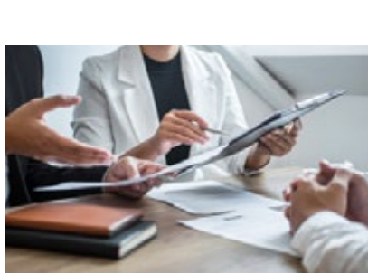
Asesorías gratuitas de empleabilidad